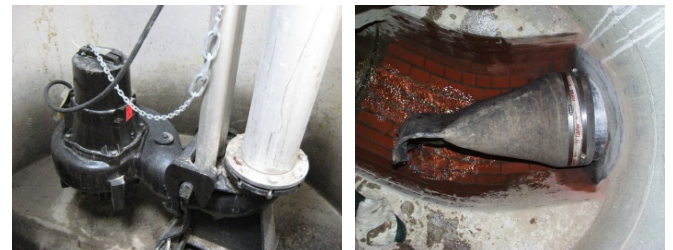
Tauchmotorpumpe / Rückflussverhinderer

Im Armaturenschacht ist ein Rückflussverhinderer montiert, mit dem während eines Hochwasserereignisses der Sieg eine Überflutung der Bundesstraße verhindert wird.