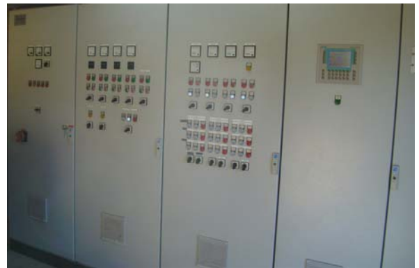
Schaltanlage im Gebäude

Die Entleerung des RÜB erfolgt durch 2 Tauchmotorpumpen mit je 50 l/s in den Vorschacht. Nach Entleerung wird zur Reinigung des RÜB eine Vakuumschwallspülung ausgelöst.