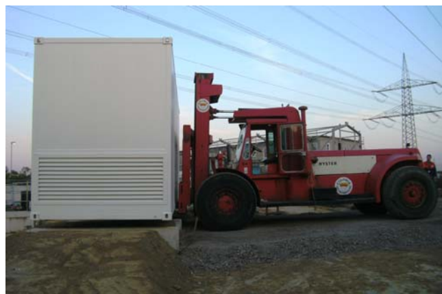
Aufstellung Container unter der Hochspannung

Um den Anlaufstrom der 42 kW Motore zu reduzieren und um die Fördermenge auf 500 l/s zu begrenzen, ist der Einsatz von Frequenzumformer notwendig.