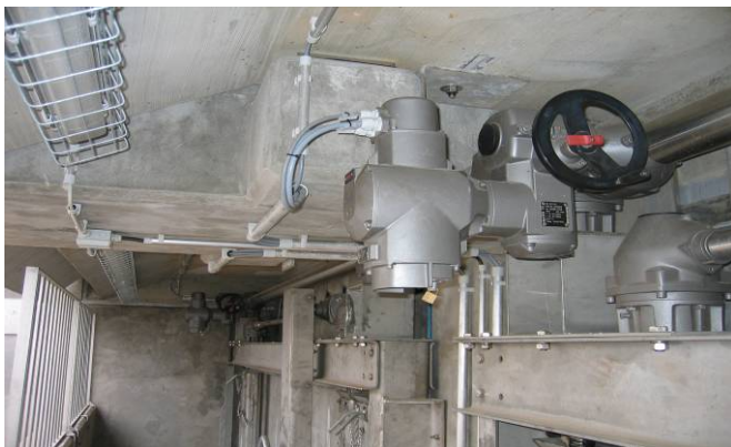
Antriebe der Absperrschütze

Das Schütz der ökologischen Rinne wird so gesteuert, dass es nur Abflüsse führt, die kleiner als das 1-jährige Hochwasser sind. Bei Überschreitung dieser Menge schließt das Schütz. Gleichzeitig wird die Regelungsrinne aktiviert, in der über das 2. Schütz der Drosselabfluss ab HQ10 auf maximal 20 m 3 begrenzt wird.