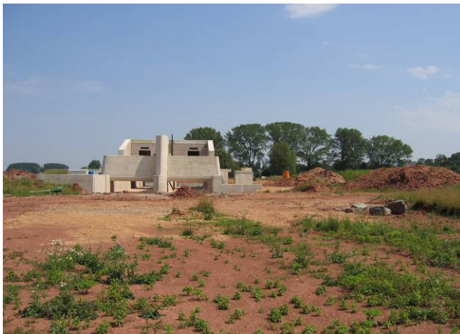
Drosselbauwerk im Rohbau

Um diverse Erftstädter Ortslagen gegen Hochwasser des Rotbachs zu schützen, hat der Erftverband ein Konzept erstellt, das den Schutz der betroffenen Ortsteile bis zu einem 100-jährlichen Hochwasser vorsieht. Dazu wurde das Hochwasserrückhaltebecken Niederberg errichtet. In der Mitte eines 670 m langen Absperrdammes wurde dazu ein Drosselbauwerk mit 2 Rinnen errichtet, das als kombiniertes Bauwerk für die Abflussregelung und die Hochwasserentlastung konzipiert ist.